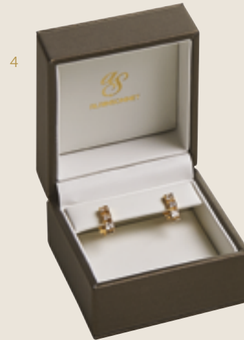
4 Boucles d'oreilles – petit modèle Réf : CL 05 Dimensions : 60 x 66 x 40 mm (20+20)

Small Earring Ref: CL 05 Dimensions: 60 x 66 x 40 mm (20+20)